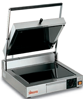
CORT VT LL