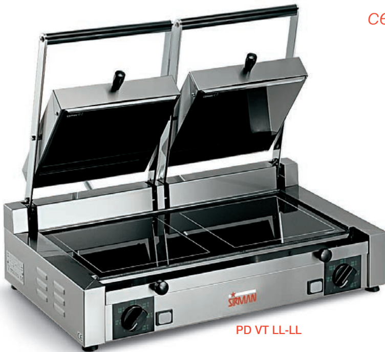
PD VT LL-LL