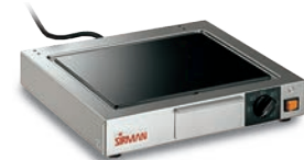
TOP CORT VT