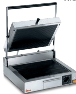
CORT VT RR