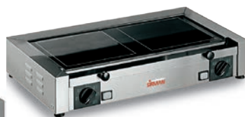
TOP PD VT