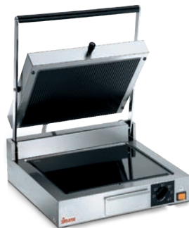
CORT VT LR