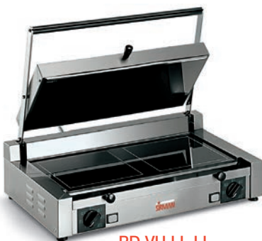
PD VU LL-LL