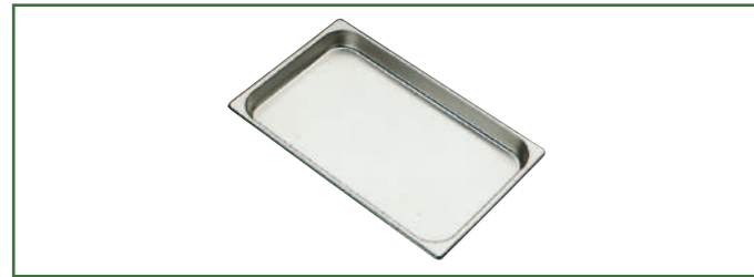
Bacinella Gastronorm GN1/1 H 40 mm Gastronorm tray Bac Gastronorm Gastronorm Behälter Bandejas Gastronorm

Accessori Optionals Accessoires Zubehör Accesorios