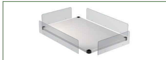
Kit sponde lexan su ripiano inferiore cavalletto Lexan sides kit for lower shelf for stand Bandes en lexan sur l'étagère inférieure pour chariot Lexan-Rändersatz zur unteren Ablage des Untergestells Kit bordes de lexan para el estante inferior del caballete

Cavalletti smontabili in acciaio inox su ruote con ripiano intermedio Demountable stainless steel stands on wheels with intermediate shelf Chariots démontables en acier inox sur roulettes avec étagère intermédiaire Inox-Untergestelle auf Rädern mit Zwischenablage Caballetes desmontables en acero inox con ruedas y estante intermedio