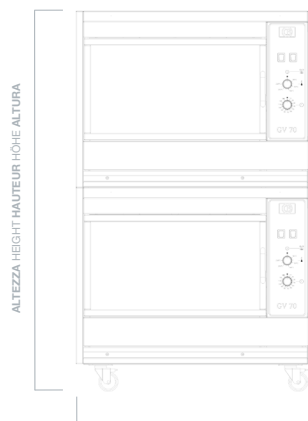
LARGHEZZA WIDTH LARGEUR BREITE ANCHURA