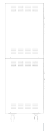
PROFONDITÀ DEPTH PROFONDEUR TIEFE PROFUNDIDAD

ATTENZIONE: al fine di evitare collisioni e conseguenti danni per l'apparecchiatura, in caso di utilizzo contemporaneo di cestelli di tipo basculante ad altri schidioni non basculanti, è necessario lasciare vuoto uno spazio prima ed uno dopo ciascun cestello basculante! NOTA: in questo caso non sarà più possibile sfruttare la capienza totale di cottura della macchina.