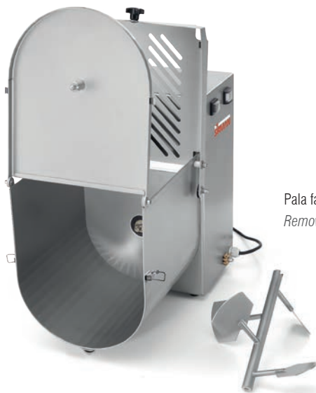
Pala facilmente rimovibile Removable mixing arm