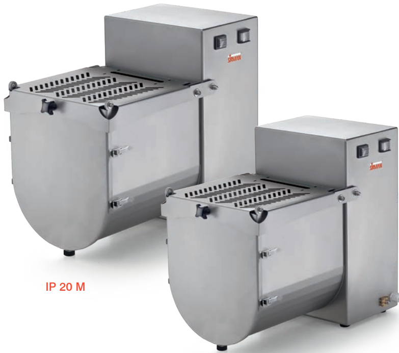
IP 20 M