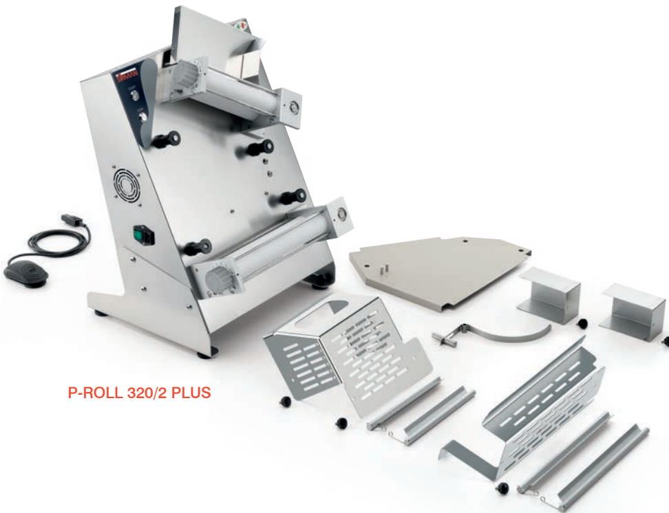
P-ROLL 320/2 PLUS