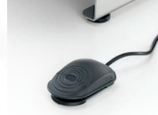
Pedaliere per versioni Plus Pedal controls for Plus versions