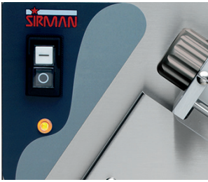
Comandi IP 54 per versioni standard Standard versions with IP 54 controls