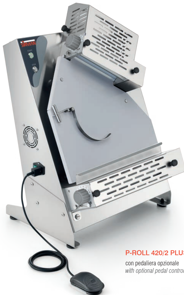
P-ROLL 420/2 PLUS

con pedaliera opzionale with optional pedal controls