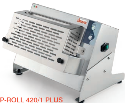
P-ROLL 420/1 PLUS