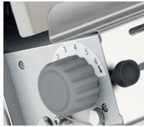
Manopole regolazione spessore rulli in plastica Adjustable thickness by plastic knobs