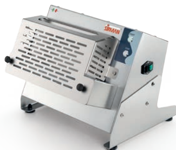
P-ROLL 320/1 PLUS

con pedaliera opzionale with optional pedal controls