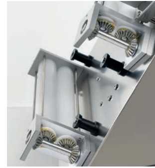
Sistema di trasmissione ad ingranaggi metallici Metal gears transmission