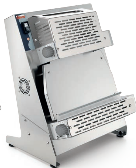
P-ROLL 420 RP