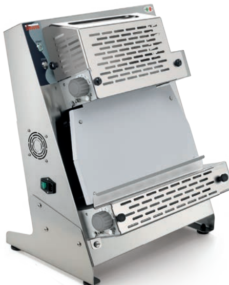
P-ROLL 420 RP PLUS