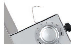
Protezione salvamano con bordo arrotondato Hand guards with rounded edges