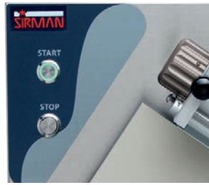
Comandi in acciaio inox IP 67 per versioni Plus Plus versions with IP 67 stainless steel controls